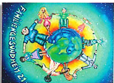
Familiengesundheit 21 e.V.

Familiengesundheit 21 e.V. (Trägerverein) Zangmeisterstraße 30, 87700 Memmingen info@familiengesundheit21.de